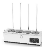
Lauda Hydro H 6 V водяная баня для выпаривания