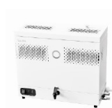
LAUDA Puridest PD 2 R (2 л/ч, нерж. сталь) лабораторный дистиллятор