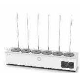
Lauda Hydro H 9 V водяная баня для выпаривания