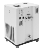
Lauda Integral IN 230 T циркуляционный термостат