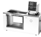
Lauda Proline PVL 24 нагревающий термостат с прозрачными стенками