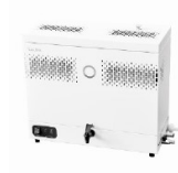
LAUDA Puridest PD 8 R (8 л/ч, нерж. сталь) лабораторный дистиллятор