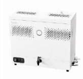
LAUDA Puridest PD 4 R (4 л/ч, нерж. сталь) лабораторный дистиллятор