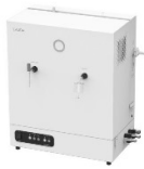
LAUDA Puridest PD 2 DG (2 л/ч, стекло) лабораторный бидистиллятор