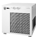
Lauda Ultracool UC 2 циркуляционный охладитель