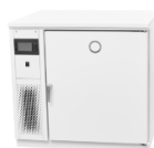
Lauda Versafreeze VF 15085 морозильный шкаф