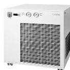
Lauda Ultracool UC-2400 SP циркуляционный охладитель