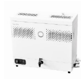
LAUDA Puridest PD 4 (4 л/ч, нерж. сталь) лабораторный дистиллятор