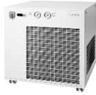
Lauda Ultracool UC-1700 SP циркуляционный охладитель