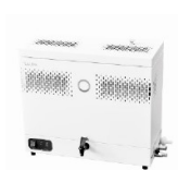
LAUDA Puridest PD 4 G (4 л/ч, стекло) лабораторный дистиллятор