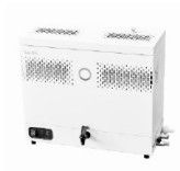
LAUDA Puridest PD 2 (2 л/ч, нерж. сталь) лабораторный дистиллятор