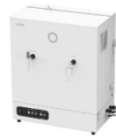
LAUDA Puridest PD 4 DG (4 л/ч, стекло) лабораторный бидистиллятор